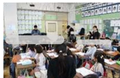
※代表児童同士が会話をしている様子